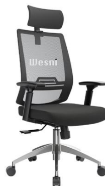
Imagen de la silla