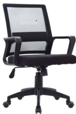
Imagen de la silla