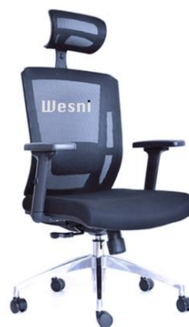
Imagen de la silla