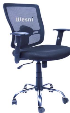
Imagen de la silla